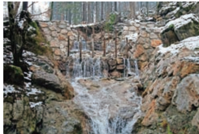
Hudourniški tok, na fotografiji sicer precej miren, v utrjeni strugi

Skupna vrednost celotne sanacije v dveh letih znaša nekaj čez 5,8 milijona evrov, od tega je bilo nepovratnih sredstev države nekaj čez 4,1 milijona evrov in 1,6 milijona evrov občinskih sredstev. "Sanacija se je letos izvajala na devetih odsekih. Obnovilo se je 2,5 kilometra vozišča, celovita sanacija se je izvedla na dveh mostovih (most v Dolini pod RIS-om in na Slapu pred začetkom naselja Čadovlje), most pri Lenartovi domačiji je bil zaradi obsega poškodb v celoti odstranjen in na njegovem mestu zgrajen nov most. Sočasno z obnovo vozišča in premostitvenih objektov so se v strugi Tržiške Bistrice in Lomščice izvajala zavarovalna dela na