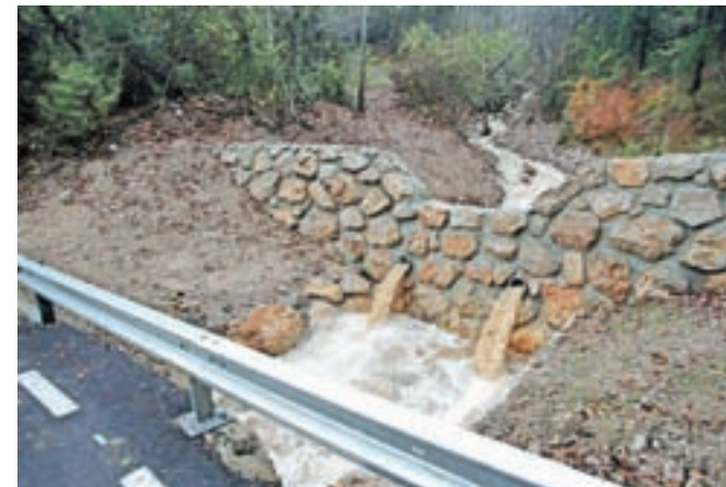
Zaplavna pregrada nad Lomom pod Storžičem s prostornino sedemsto kubičnih metrov