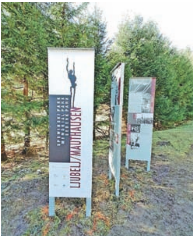
Novi informacijski panoji pred vhodom v spominski park

Poglobljen vpogled v medvojno dogajanje pod Ljubeljem bodo obiskovalci (po sprostitev ukrepov zaradi epidemije) lahko dobili na novi stalni razstavi Koncentracijsko taborišče Ljubelj/Mauthausen 1943–1945 v kletnih prostorih gostišča Karavla. Razstavo je pripravil Trziški muzej, finančno pa omogočila Ministrstvo za kulturo in Občina Trzič.