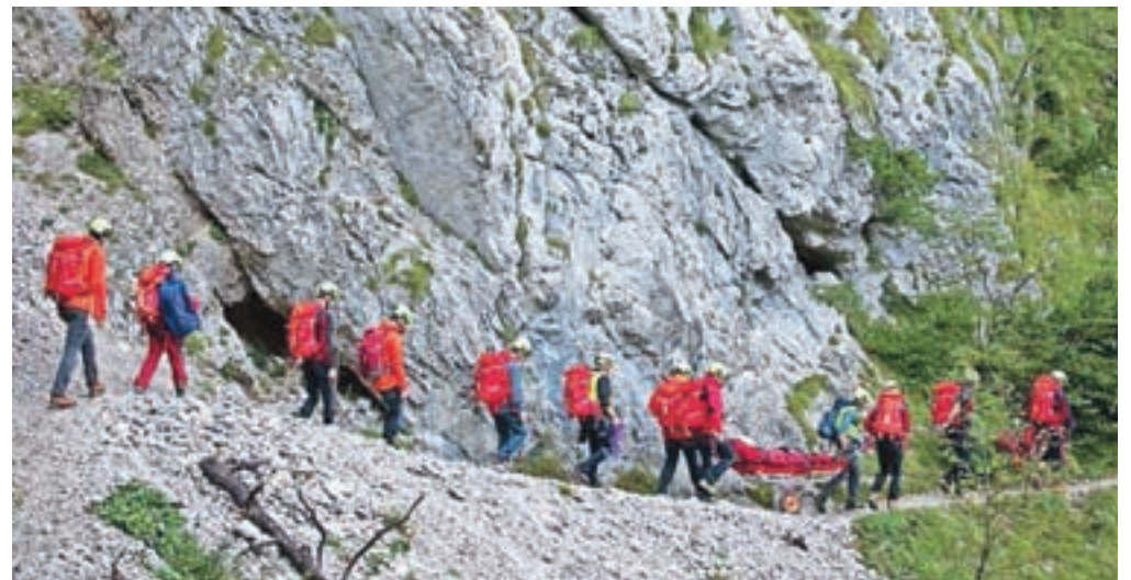
Skupna vaja na vzhodnih pobočjih Begunjščice s kolegi iz GRS Radovljica, s katerimi si delimo tudi del pristojnosti reševanja na območju Zelenice

ljudem, ki so se poškodovali ali znašli v težavah v gorah ali težko dostopnih mestih. Letos smo bili do decembra v akcijo poklicani 19-krat, kar je manj kot v preteklih letih. Tega smo seveda veselili, saj to kaže, da kljub povečanemu obisku sredogorja in visokogorja struktura obiskovalcev gora na področju Trziča govori v prid izkušenim in dobro opremljenim planincem. Pri delni analizi smo ugotovili, da smo letos reševali precej težje primere in bolj poškodovane ljudi, ki so žal imeli smolo in se jim je zgodila nesreča. Opažamo tudi nekaj več posredovanj zaradi bolezenskih stanj. Helikopter nam je na pomoč priskočil petkrat. Zanimivo je tudi dejstvo, da smo v času prvega vala epidemije od marca do junija imeli zgolj eno posredovanje. Dejstvo je vsaj deloma povezano z odsotnostjo turistov in s tem, da kljub večje-