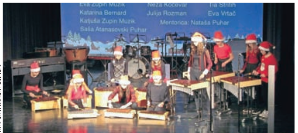
Glasbena šola Tržič v decembru napoveduje virtualne koncerte, ki bodo objavljeni na spletu. Na fotografiji njihova Orffova skupina z lanskoletnega božičnega koncerta.