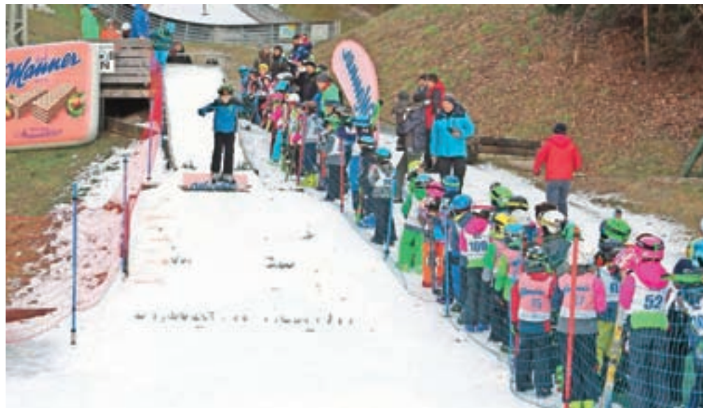
S smučarskimi skoki se bolje lahko spoznate tudi na treh dogodkih, ki jih bo klub organiziral v zimski sezoni.

Sebenje – Nordijski smučarski klub Tržič FMG se tudi v teh neprijetnih časih trudi in kar se da dobro skrbi za svoje člane. Dela in aktivnosti v klubu ne manjka, še naprej si prizadevamo, da bi v svoje vrste privabili čim več mladih tekmovalk in tekmovalcev. Zaradi ukrepov, ki ta čas veljajo po vsej državi, ne moremo natančno napovedati dogodkov, ki bi jih radi izpeljali z našimi najmlajšimi člani. Smo pa v klubu pripravljeni, da v letošnji sezoni izpeljemo številne dogodke, s katerimi bi smučarske skoke približali novim tekmovalcem, vse to pa bi predstavili na kar se da zabaven način. V načrtu imamo, da bi novim članom in članicam skoke predstavili tudi skozi tečaj alpskega smučanja, seznanili bi jih s tekom na smučeh, vedno pa