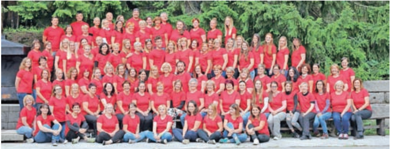
Kolektiv Vrtca Tržič junija letos

zbor vrtca še nikoli ni štel toliko članov kot tokrat, spesnili in uglasbili smo celo svojo novo himno. Prireditev je bila načrtovana za sredino aprila, pospremila pa bi jo pestra razstava v Galeriji Atrij Občine Tržič. Ob koncu februarja smo ugotavljali, da načrtovanje takšne prireditve in razstave nikakor ni mačji kašelj, sploh ker smo v pripravo vključili starše in seveda otroke, zaposleni pa smo bili vključeni prav vsi do zadnjega. Druge možnosti kot dati vse od sebe sploh nismo videli. In drug drugega smo spodbujali, čeprav se je mnogim poznala sled utrujenosti, saj tudi pri vsakodnevnem delu z otroki velja enako – dajati vse. Finančno nas je tudi za prireditev podprla občina ustanoviteljica, a tudi na poziv sponzorjem se je odzvalo kar nekaj tržiških podjetij. Zahvaljujemo se vsem, z namenom in obljubo, da bomo vse zbrano – četudi bo praznovanje malo